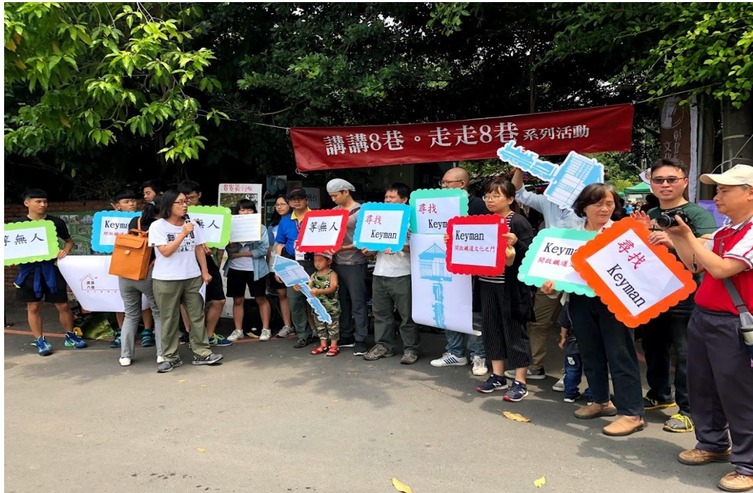
(圖片說明：邀請大家寫下對宿舍村的願景，拚出打開宿舍村的鑰匙)

我們找了地方的社群，像一些國中小，我們希望這些事情像種子一樣由小開始扎根，我們很知道文化部和教育部，長年來一直想要推動所謂的美學教育、美感教育，甚至是地方的文化概念教育，但其實我們有時候也會流於形式，就是做一個 paper。我們的用意是要你們來這地方感受一下這個環境，我們要透過這個公共領域、公民參與，結合很多人來認識自己的家鄉和文化、有形和無形的文化資產，讓大家能了解這件事情，所以我們才先從一個巷子開始，做一個八巷的紀錄，用八巷這件事情串聯，從他的空間到巷道，並去談每一件實體建築背後的意思。像一棟房子有些人會在意他的樣子、他的價值或特色比較實體面，像八巷是因為建築物和圍牆和樹的排列而被營造出來，從開放八巷再回來談它的故事文化史蹟，並談房子本身物體價值和房子到底背後故事為何)這一連串的動作就是要公民參與，主要就是這個用意。