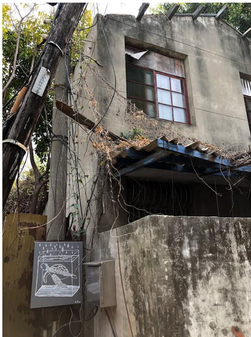
(圖示：彰美路八巷臺鐵舊宿舍現況。)

為了民眾安全考量，基本上現在是全部都不開放，其實這一路下來縣政府或是臺鐵態度基本上都是一致的，是以民眾的安全為第一，主責單位也不會不與我們對話，我們也是尊重不開放這個部分因為畢竟安全部分我們大家一起維護。