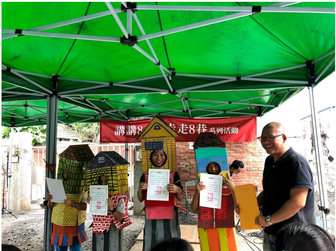
(圖示：國小師生參與「走走八巷·講講八巷」的活動。)

其實，「走走八巷·講講八巷」很簡單的就是，這個地方，民間自己來，做成這樣子，那，如果公部門願意投入心力、資源，那相信一定會有更好的成果出現，就有 power 了這樣。